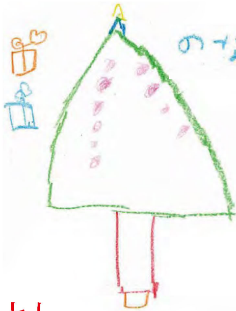
の な か い ん と